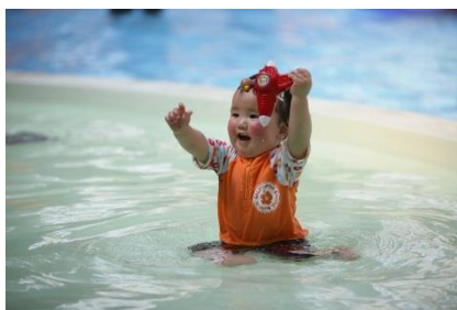
▲施設内には、水遊び用のおむつ着用でご利用可能な乳児用プール「天使の水場」があり、お子さまのプールデビューにオススメです。