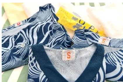
▲館内着は、女の子ムームー、男の子はアロハを用意(90cm～)