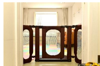
▲入り口にはゲートを設置。室内は土足厳禁