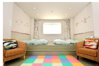
▲お布団は小上りのフロアに直接敷くタイプ