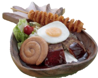
▲ビッグアロハココモコ