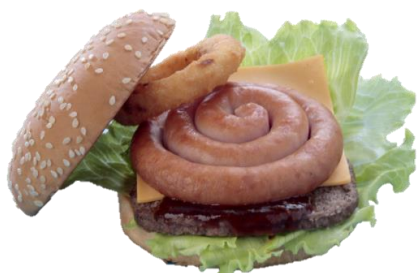
▲ビッグアロハバーガー

「ビッグアロハ」オープンに合わせ、館内各店舗にて、ここでしか味わえないオリジナルフードが続々登場します。アトラクションだけではなく、フードでも「ビッグアロハ」の世界をご堪能ください。