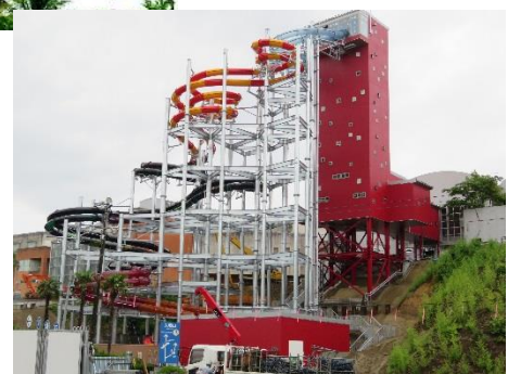
※ビッグアロハ(7/4 現在)