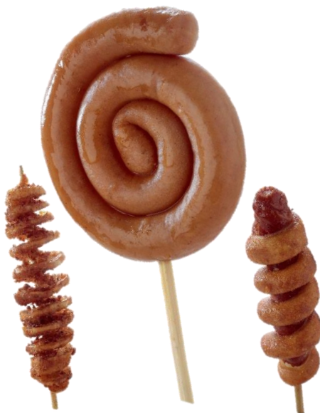
▲ぐるぐる商品各種