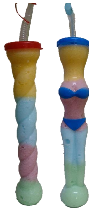
▲レインボーフローズン