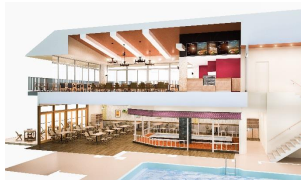
<カフェイメージパース>

これまでボディスライダー「ビッグアロハ」には、滑走した後に休んだり、ご家族やグループの中で滑走しない方がゆったりと待機する場所がなく、お客様からも、迫力あるスライダーの構造を間近に眺めたい、写真に収めたいといった要望をいただいております。