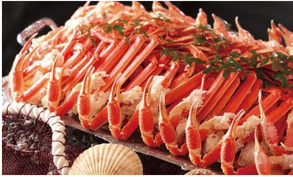
リニューアルオープン記念のプレミアム メニュー・かに食べ放題