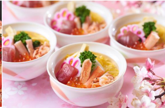
季節のお料理メニュー 春の海鮮チラシ