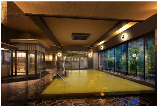
女性大浴場(混合泉)

男女の大浴場それぞれにて、黒い湯花が希少な泉質・黒湯と、黒湯と白湯の混合泉の2種類の泉質が楽しめます。離れにある百畳露天風呂と合わせて、鳴子温泉ならではの豊富な湯量と泉質を、館内で湯めぐりすることでご堪能いただけます。既存の構造を活かして、より快適に温泉を楽しんで頂けるよう内装もリニューアルいたしました。