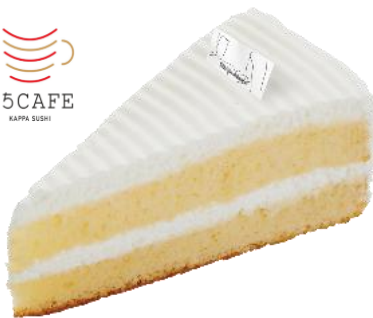
『Supervised by Takahiro KOMAI from Belle id é e pÂtisserie! プレミアムクリームケーキ』 173円（税込 190円）～

かっぱ寿司の人気の定番スイーツ『クリームケーキ』。クリームのくちどけが、よりなめらかになりました。