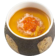
『蟹といくらの茶碗蒸し』 363 円 (税込)