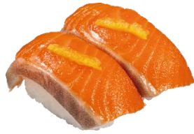
『柚子塩サーモン』 二貫 110 円 (税込)