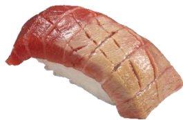
『本鮪とろ炙り』 一貫363円（税込）