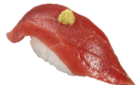
『本鮪上赤身わさびのせ』 一貫242円（税込）