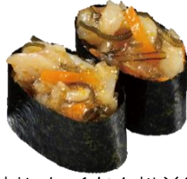
『いか刺したくあん松前風』 二貫 110 円 (税込)