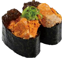
『あん肝ポン酢ジュレ』 二貫 110 円 (税込)