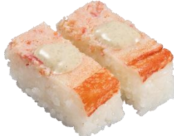
『蟹の押し寿司』 二貫 363 円 (税込)