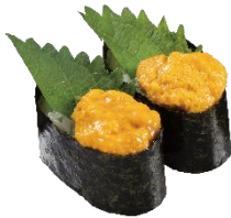
『うに軍艦』 二貫 363 円 (税込)