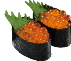
『鮮極いくら』 二貫 363 円 (税込)