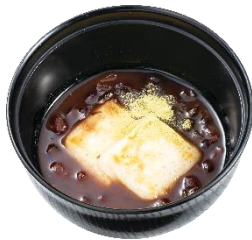
『焼餅入り北海道あずきぜんざい』 363 円 (税込)