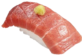
『本鮪とろ わさびのせ』 一貫363円（税込）