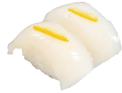
『柚子塩真いか』 二貫 110 円 (税込)