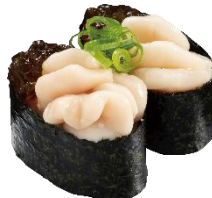
『真鱈白子ポン酢ジュレ』 二貫 187 円 (税込)