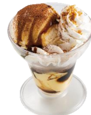
『ティラミスプリンパフェ』 429 円 (税込)