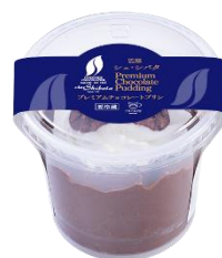
プレミアムチョコレートプリン お持ち帰り価格 320円（税込）