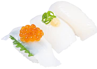
3種のいか食べ比べ (あおりいか いくら のせ・ 甲いかねぎ生姜・真いか) 三貫 297円(税込)

一皿で3種のネタが楽しめる食べ比べ皿は、「すし呑み」にもぴったりです。生ビールと一緒に楽しみください。※横浜西口エキニア店・道頓堀戎橋店は価格が異なります。