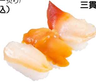
3種の貝食べ比べ (つぶ貝・赤貝・ほっき貝) 三貫 297円(税込) ※東日本での販売