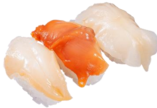
3種の貝食べ比べ (つぶ貝・赤貝・石垣貝) 三貫 297円(税込) ※西日本での販売