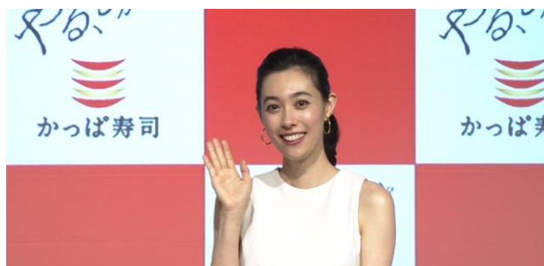
新イメージキャラクターに吹石一恵さんが就任！ かっぱ寿司 新CM発表会

CMスペシャルサイト : http://www.kappasushi.jp/CM/