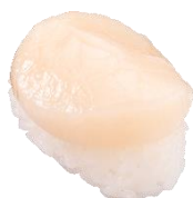
北海道産ほたて 一貫 110円（税込）