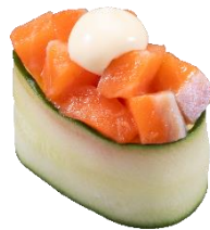
特盛サーモンぶつマヨ かつば軍艦 一貫 110円（税込）

まろやかな味わいのマヨネーズとサーモン、きゅうりが織りなす味わいが口に広がります。