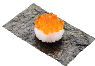
北海道産いくら包み 一貫 110円（税込）