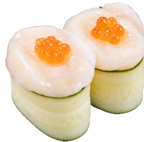
北海道産ほたて&いくら かつば軍艦 二貫 297円（税込）

肉厚で甘みと旨みが詰まった北海道産ほたてといくら、きゅうりを頼張る食べ応えある一品です。