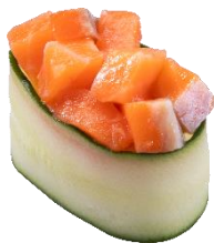
特盛サーモンぶつ かつば軍艦 一貫 110円（税込）