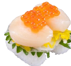
北海道産いくら&ほたて たくさん盛り 二貫 374円（税込）