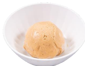
醤油キャラメルアイス 143 円（税込）