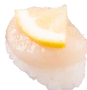
北海道産ほたて塩レモン 一貫 110円（税込）