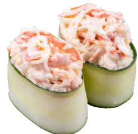
かにカマサラダ かつば軍艦 二貫 110円（税込）