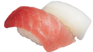
『まぐろ・いか二種盛り』 二貫 110円（税込）