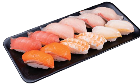
『にぎり 12貫～人気ネタづくし～』 十二貫 748円（税込）

お持ち帰り商品も、すべて「まぐろ（赤身）のにぎり」を大切にご提供いたします。秋は、大切な人やご自身の長寿・健康を願う敬老の日や、祖先をはじめ大切な人に想いをはせるお彼岸、家族やご友人と楽しむお月見や秋祭り、運動会、スポーツ観戦などのイベントが目白押しです。さまざまなお食事のシーンでご利用いただけるお持ち帰り商品をご利用ください。