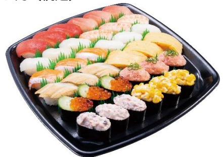
『定番 12種セット（3人前）』 36貫 2,430円（税込）

※公式アプリ： https://www.kappasushi.jp/app.html