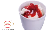
『莓のふんわりチーズムース』 330円（税込）