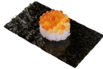
※店内飲食限定 『2種いくら合盛り包み』 一貫 110円（税込） (いくら・つきみいくら)