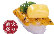
『炙りコーンバターにぎり』 一貫 110円（税込）