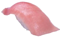
『本鮪中とろ』 一貫 300円（税込）