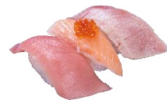
※店内飲食限定 『とろ三味～本鮪中とろ使用～』 三貫 690円（税込） (本鮪中とろ・とろサーモンいからのせ・ 本鮪中とろ塩炙り)