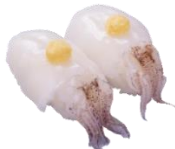
『姿やりいか』 二貫 110円（税込）

※【本鮪中とろ】販売中は、定番メニューの【みなみ鮪中とろ】の販売を休止いたします。