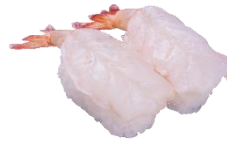
『生えび』 二貫 200円（税込）