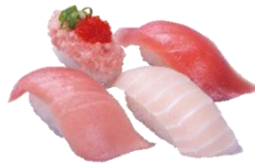
※店内飲食限定 『かっぱのまぐろ4種食べ比べ』 四貫 550円（税込） (本鮪中とろ・びんちょうハラモ大切りまぐろ・ ねぎとろ とびこのせにぎり)