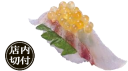
『活め真鯛 つきみいからのせ』 一貫 200円（税込）