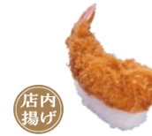
『えびフライにぎり』 一貫 110円（税込）