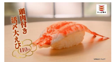
(NA 下野さん) 大海老も…