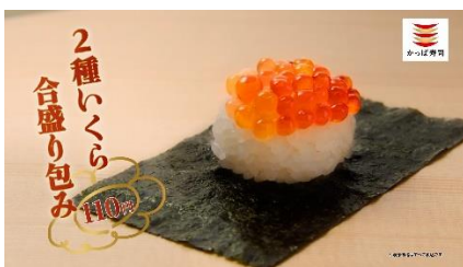
(NA 下野さん) いくらも、