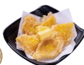
『コーン天バター醤油仕立て』 一貫 430円（税込）