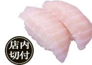
『びんちょうハラモ』 二貫 110円（税込）