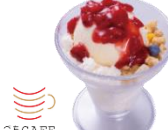
『莓のふんわりチーズムース& パニラパフェ』 450円（税込）