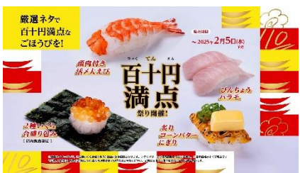
(NA 下野さん) 祭り開催！