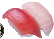
『まぐろ2種盛り』 二貫 110円（税込） (まぐろ・びんちょうハラモ)