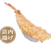
『金頭天にぎり』 一貫 110円（税込）