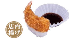
『えびフライにぎり ～ソース付き～』 一貫 110円（税込）