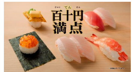
(NA 下野さん) ひゃくてん！満点祭り！