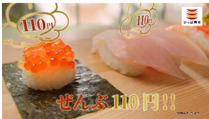
(NA 下野さん) ぜんぶ 110円！