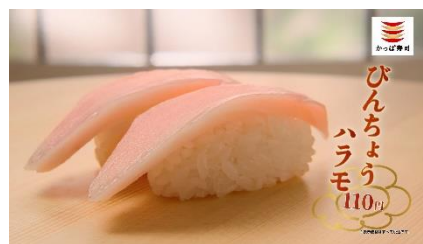
(NA 下野さん) びんちょうも、