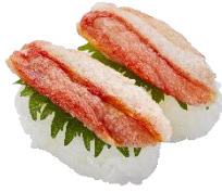
『蟹にぎり』 二貫 160 円 (税込)