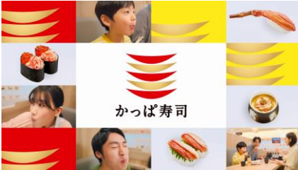
〈NA 下野さん〉かっぱ寿司。春かに祭り！