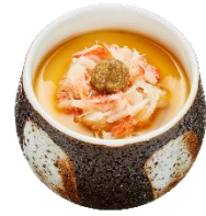
『ずわい蟹の茶碗蒸し』 390 円 (税込)