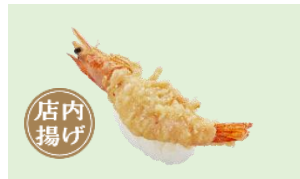
『陸上養殖 静岡県産 幸えび天にぎり』 一貫 230 円 (税込)

頭から尻尾まで殻ごとお召上がりいただける柔らかさが特徴の、環境に優しい「幸えび」を、殻ごと 1 尾天ぷらにし、塩をかけてにぎりで仕上げました。殻ごと揚げることで、殻の香ばしさが加わり、えびの風味を一層感じていただけます。