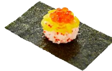
『いくらととびっこ飯の海苔包み』 一貫 160 円 (税込)