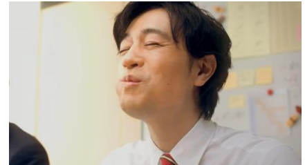
〈斎藤さん（心の声）〉うまいっ・・・！