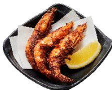
『陸上養殖 静岡県産 幸えびのから揚げ』 590 円 (税込)