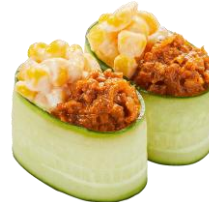
『お豆で作ったキーマカレー&感動コーンかっぱ軍艦』 二貫 110 円 (税込)