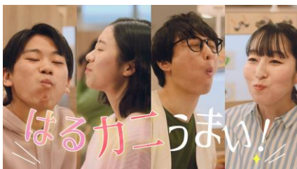
〈NA 下野さん〉はるかにうまいっ！