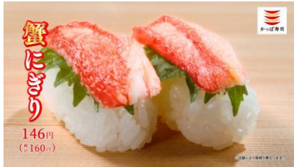
〈NA 下野さん〉春のかにつくし！