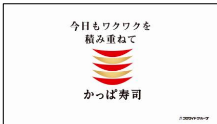
〈下野さん〉かっぱ寿司♪