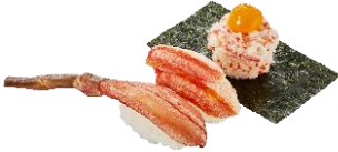
『贅沢蟹三昧』 三貫 690 円 (税込)