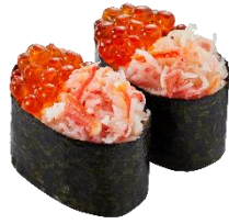
『蟹いくらの合盛り軍艦』 二貫 260 円 (税込)