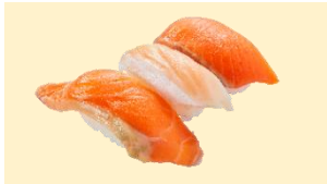
『3 種のサーモン食べ比べ』 三貫 330 円 (税込)