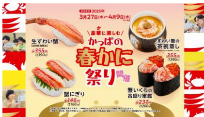
〈オフ斎藤さん〉今日もワクワクを積み重ねて