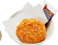
『蟹クリームコロッケ ～北海道産生乳使用～』 210 円 (税込)