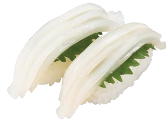
『北海道産 するめいかソーメン』 二貫 220 円 (税込)

日本有数のしらすの漁場の駿河湾産の釜揚げしらすは、ふっくら柔らか。ほのかな塩味とシャリがベストマッチです。