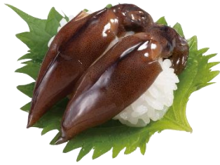
『兵庫県産 ほたるいかの醤油漬け』 一貫 165 円 (税込)

「ほたるいか」をまるごと醤油ダレに漬け込みました。ねっとりした舌ざわりとほろ苦い味わいを、シャリと一緒に大葉で包んで楽しめる、大人向けの一品です。