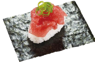
『本鯖中落ち包み』 一貫 220円（税込）

日本近海で餌を食べ丸々太り秋ごろに南の暖かい海に戻ってくる「戻り鰹」。中でも脂の乗った鰹の事を『とろかつお』と呼びます。とろける脂の旨みをお楽しみください。