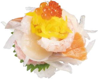
『まるで海鮮丼 どっさり重ね盛り』 二貫 330円（税込）

“海鮮丼”をお寿司に!? ねぎとろ、サーモン、ほたて、甘えび、いくら、とびこが“どっさり”と！ 様々なネタの食べ合わせを贅沢に楽しめます。