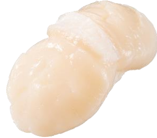
『オホーツク海 ジャンボほたて』※数量限定 一貫 330円（税込）

“海鮮丼”をお寿司に!? ねぎとろ、サーモン、ほたて、甘えび、いくら、とびこが“どっさり”と！ 様々なネタの食べ合わせを贅沢に楽しめます。