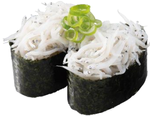
『駿河湾産 釜揚げしらす軍艦』 二貫 110 円 (税込)

青森県産の旨み・甘味たっぷりのホタテを浜焼き風にしたら…？香ばしくうまいお寿司の完成です！