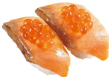
『郷土料理はらこ飯 だし醤油炙りサーモンいぐらのせ』 二貫 220円（税込）

鯖の王様と言われる「本鯖」。そんな鯖の中骨周りから少量しか取れない中落ちは「究極の赤身」とも呼ばれております。その濃厚な味わいを有明産の海苔でくるっと巻いて一口で召し上がってください!