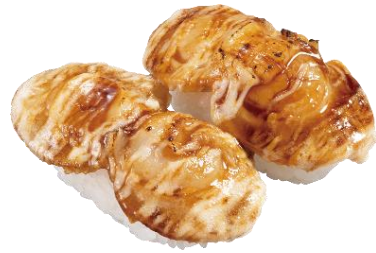
『青森県産 蒸しホタテの浜焼き風にぎり』 二貫 220 円 (税込)

「ほたるいか」をまるごと醤油ダレに漬け込みました。ねっとりした舌ざわりとほろ苦い味わいを、シャリと一緒に大葉で包んで楽しめる、大人向けの一品です。