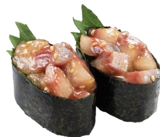
『九州郷土料理 寒ぶり りゅうきゅう仕立て』 二貫 165円（税込）

郷土料理“はらこ飯”をかっぱ寿司流にアレンジ! かっぱ寿司オリジナルのだし醤油を塗って炙ったサーモンに、いぐらを乗せてお寿司仕立てでご提供します。