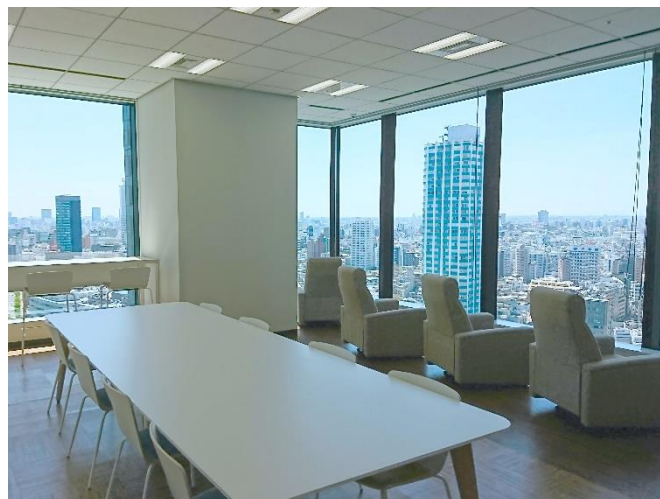
リフレッシュルーム