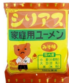
【U-TA プロデュース】ユ-麺（みそ味）