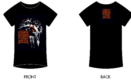
【TSUTAYA 限定】Halloween T シャツ