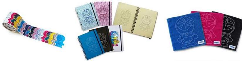
THE ドラえもん展 OSAKA 2019 ©Fujiko-Pro