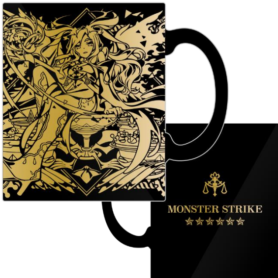
モンスターストライク マグカップ 光をもたらすルシファー