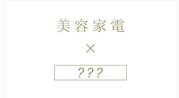
「パナソニックビューティ 新・本格美容メソッド」スペシャルティザー動画