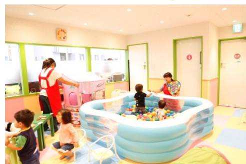
「ママスクエア」イメージ