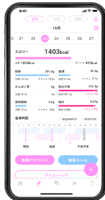
BeTEAMの食事記録データ画面