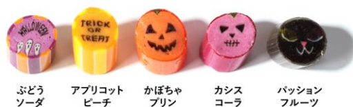
ぶどうソーダ アプリコットピーチ かぼちゃプリン カシスコーラ パッションフルーツ