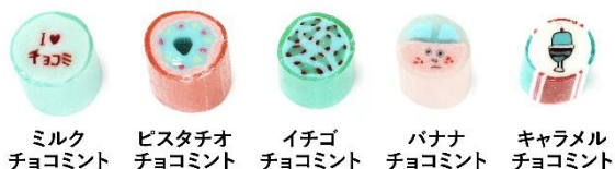
ミルク チョコミント ピスタチオ チョコミント イチゴ チョコミント パナナ チョコミント キャラメル チョコミント