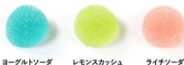
ヨーグルトソーダ