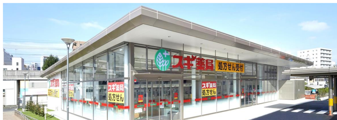
名大病院敷地内の「スギ薬局 名古屋大学病院店」