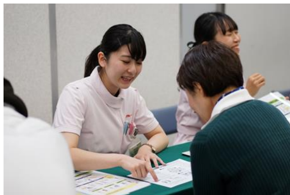
▲薬剤師・管理栄養士による健康相談