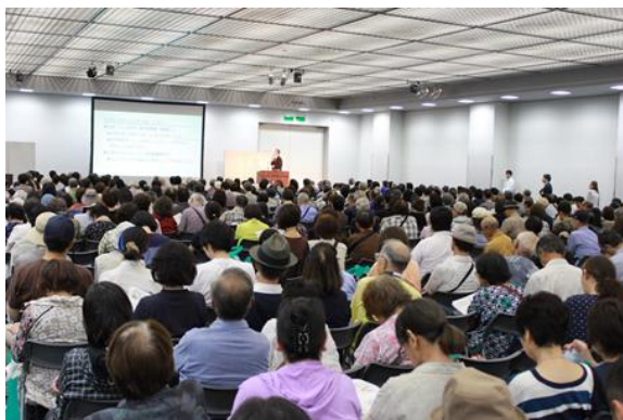
▲医師による講演会