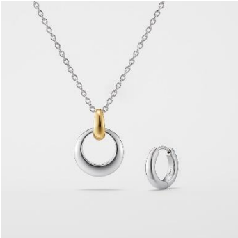
SV(K18YGc/PTc) Necklace&Pierced Earring set ¥26,400

ネックレスと片耳ピアスのセットは、ネックレスのトップを外してピアスに通してもお楽しみいただける 2way 仕様。ミニマルながらも地金の曲線美が上品なデザインが特徴です。ニットやマフラーなどで顔周りにボリュームが増える冬の季節こそ、ジュエリーのアクセントによって印象をアレンジして。