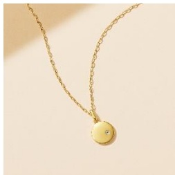
From left SV(K18YGc) Necklace / LG Diamond ¥16,500

シンプルなイエローゴールドカラーのコインチャームにラボグロウンダイヤモンド ※2 が上品に輝く、cofl by 4℃らしいネックレスが登場。コインチャームはチェーンから取り外しが可能なため、チェーンネックレスとしても、他のチャームを通してもお楽しみいただけます。アジャスター仕様のため、ショートネックレスと重ね着けしたり、短く留めてチョーカーとしても使えるアレンジ自在な一本。地球のように丸いラウンドのプレートに、上品かつ力強い一筋の輝きを放つラボグロウンダイヤモンドが、美しい未来を願う心を象徴するようなアイテムです。