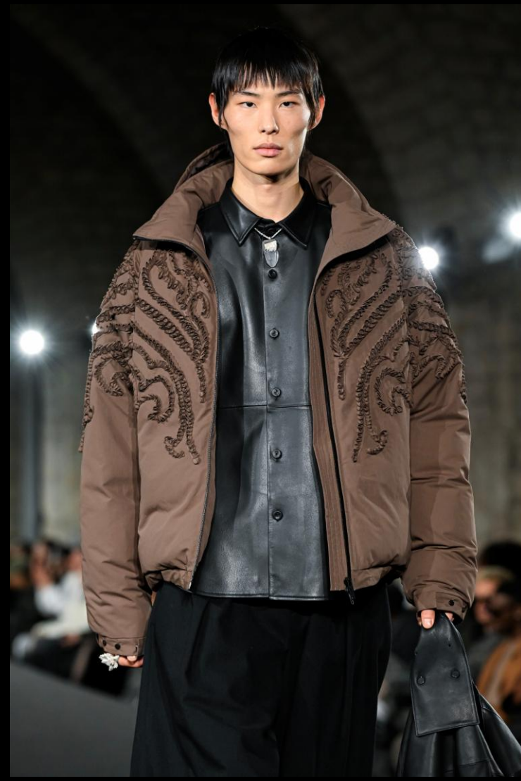
TAAKK Paris Fashion Week 抜粋 Autumn-Winter 2026 Collection Impulse, Springing Up 湧き上がる衝動