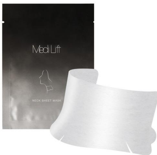
メディリフト ネックシートマスク

ヤーマン株式会社（代表取締役社長：山崎貴三代、所在地：東京都江東区）は、顔の下半分にアプローチするウェアラブル EMS 美容器「メディリフト」シリーズから、「塗る、メディリフト。」というコンセプトのもと作られたスキンケアプログラム『メディリフトスキンアーキテクト』より首もとの乾燥による小ジワを目立たなくしながら*1、肌に透明感*2を与える首もと専用シートマスク「メディリフト ネックシートマスク」を新発売いたします。5月11日（月）よりヤーマン直営店・百貨店、「メディリフトストア」、一部バラエティショップ、一部の通販と公式通販サイト「ヤーマンオンラインストア」にて順次発売開始いたします。