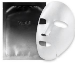
メディリフト スキンタイトニングマスク