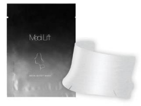
メディリフト ネックシートマスク