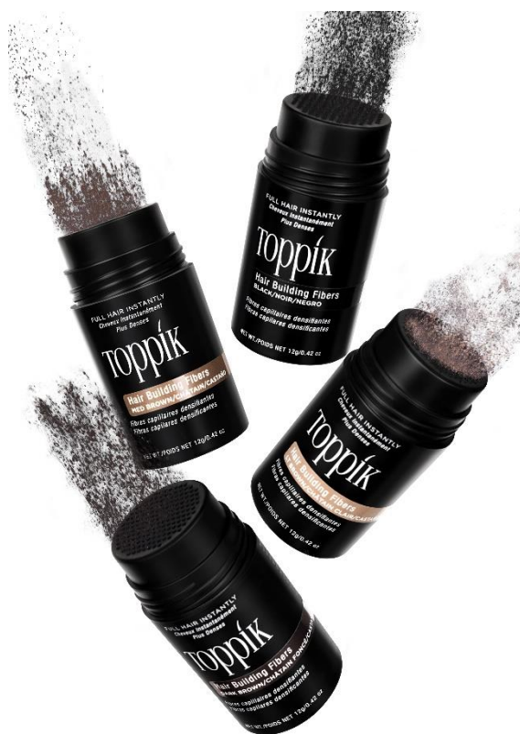
TOPPIK ヘアビルディングファイバー （日本での取り扱いカラーは2色のみ）