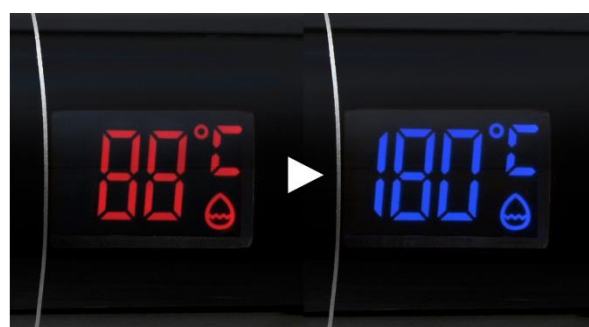
リアルタイムヒートセンシング