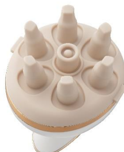
もみ出しアタッチメント