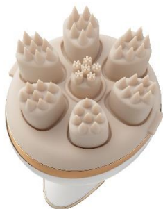
ニードルアタッチメント

「ニードルアタッチメント」と「もみ出しアタッチメント」の 2 種類のアタッチメントで、頭皮のケアから顔のリフトケア*2 まで。デコルテ、首、肩、こめかみなど、顔周りにもお使いいただけます。