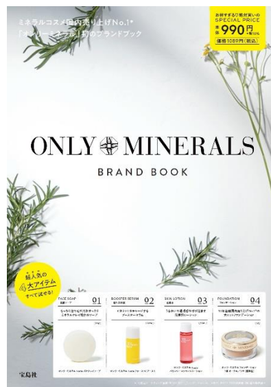
『ONLY MINERALS BRAND BOOK』（宝島社）