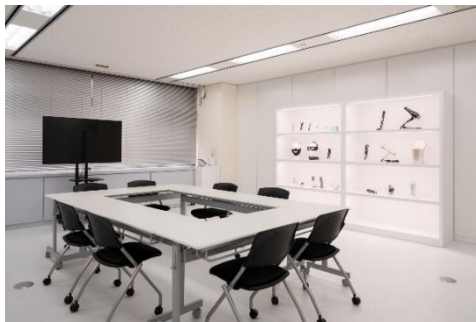
プレゼンテーションスペース