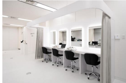
モニター試験を行う肌測定コーナー