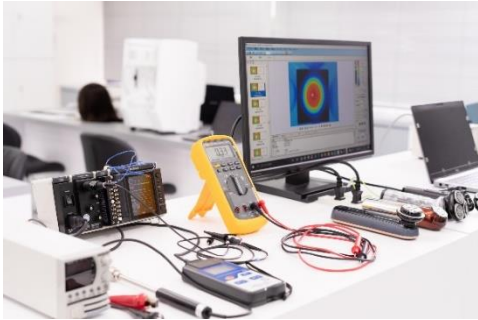
美容機器の電気エネルギーを設計し効果検証

美容機器開発の礎となる電気波形を設計し、その効果効能を検証する設備を整えており、本ラボにて日々実験、研究を重ねています。また、プレゼンテーションスペースも備えており、今後は研究開発の発表会や製品勉強会を開催し、新しい技術や研究内容を形にする製品開発のプラットフォームとしても活用してまいります。