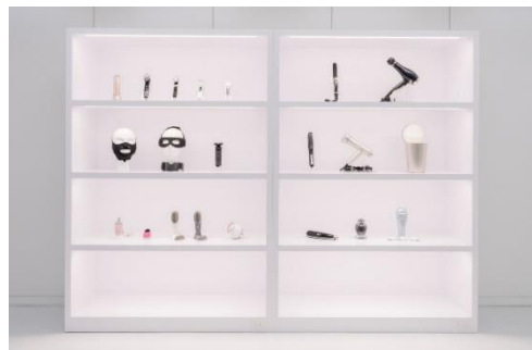
美容技術研究のもとに開発された製品