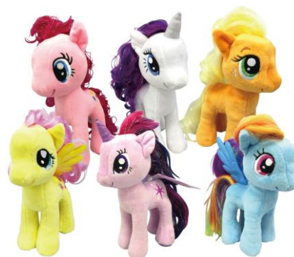
MY LITTLE PONY ぬいぐるみ S : ¥1,800 (税抜) M : ¥3,500 (税抜)