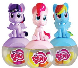
MY LITTLE PONY ボブルヘッド ¥650 (税抜)