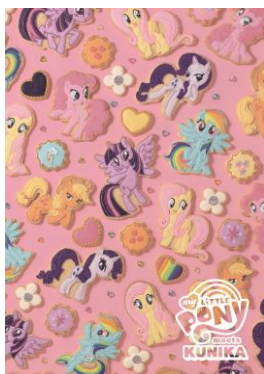
KUNIKA デザイン MY LITTLE PONY クリアファイル (アニメ/レトロ) ¥350 (税抜)