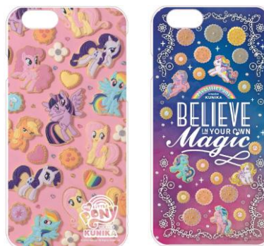
KUNIKA デザイン MY LITTLE PONY iPhone6/6s シェルケース (アニメ/レトロ) ¥2,200 (税抜)