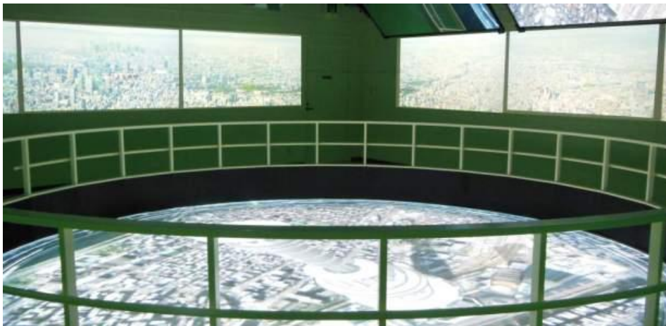
イチオシ!「展示室2 フライングラボ」の360°パノラマビュー!

レジャーにぴったりなこの季節、ゴールデンウィークのお出かけに、皆さまお誘い合わせの上、ご来場ください。