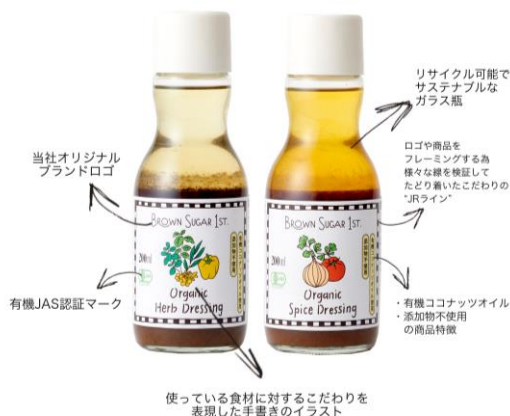
使っている食材に対するこだわりを表現した手書きのイラスト

この商品のおいしさやコンセプトに共感してくださる製造工場様のご協力のもと、原材料はもちろん、味にもこだわり、何度も試作・試食をくり返し商品化まで1年を費やして開発。小売店の皆さまのご協力のもと、2016年6月15日に一斉発売。今も多くの方にご愛用いただいております。「子どもと一緒に安心して食べられるドレッシングが欲しい！」「子供たちに野菜のおいしさをもっと知ってほしい！」という願いを込めて、開発段階から下記の点にこだわりました。