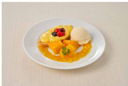
チーズタルト～ごろっとマンゴー添え～ 548円

ホイップクリームとの相性も良く、大人の方もお子さまもお楽しみいただける珈琲ゼリーです♪