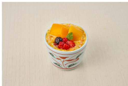
マンゴードルチェ 438円