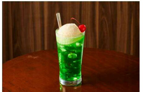
メロンクリームソーダ 438円

<お問い合わせ先> サトフードサービス株式会社 和食さとマーケティング部 (担当) 山口・朴 TEL:070-1305-6114 E-mail: hanbaisokusin@sato-rs.jp オフィシャルHP: https://sato-res.com/sato/