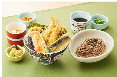
秋の味覚天井御膳 1,499円(税込1,648円)