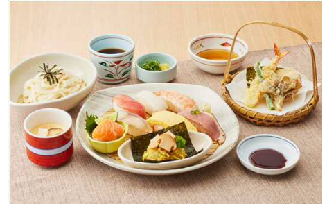
季節のすし和膳<秋> 1,499円(税込1,648円)