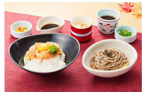
サーモンとろろ丼御膳 1,599円(税込1,758円)