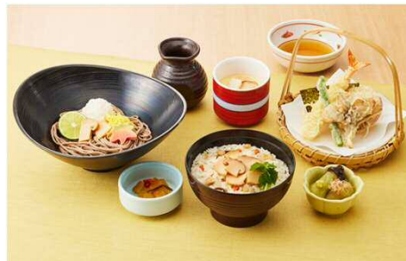
松茸ご飯と松茸すだちおろしそば 1,499円(税込1,648円)