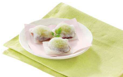
店仕込み シャインマスカットの 手包みミニ大福 299円(税込328円)

<お問い合わせ先> サトフードサービス株式会社 和食さとマーケティング部 (担当) 山口・朴 TEL:070-1305-6114 E-mail: hanbaisokusin@sato-rs.jp