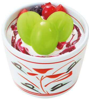
シャインマスカットのドルチェ 499円(税込548円)

人気のドルチェシリーズの新作です。 長野県産シャインマスカットと、マスカットジュレやぶどうソースなどを使用しました。 中にはバニラアイスや白玉などの、お楽しみが隠れています!!