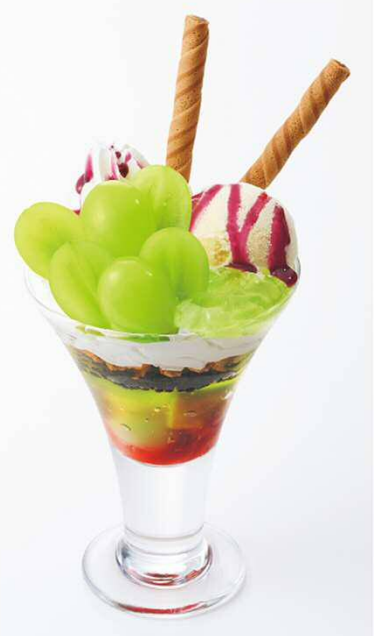
シャインマスカットパフェ 699円(税込768円)

フレッシュな長野県産シャインマスカットが主役の贅沢パフェです。濃厚なぶどうソースがアクセントになり見た目にも彩り豊かです。