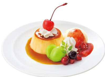
季節のプリンアラモード～シャインマスカット～ 599円(税込658円)

フレッシュな長野県産シャインマスカットが主役の贅沢パフェです。濃厚なぶどうソースがアクセントになり見た目にも彩り豊かです。