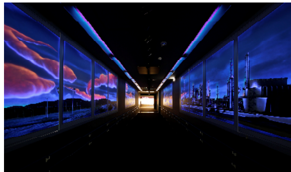
図2 ブラックライトによる通路演出