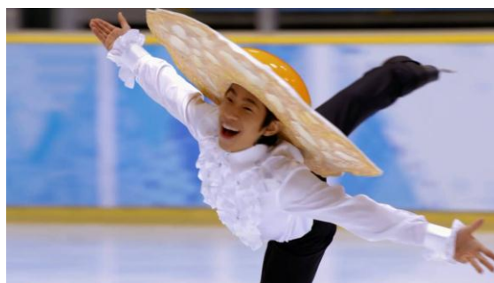
TVCM「セラフィット スケート」篇