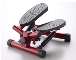
健康ステッパー ナイスデイ

自宅で手軽なフィットネスができる商品群を展示します。「健康ステッパー ナイスデイ」や骨盤運動マシン「ながらウォーク」、美脚フィットネスマシン「レッグマジック プラス」、ディズニーの名曲で楽しく踊れるダンスエクササイズ DVD「ディズニー・マウササイズ」などをご紹介します。さらに、「ワンダーコア」シリーズの新商品もお披露目いたします。