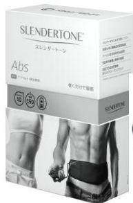
スレンダーートン アブベルト 男女兼用