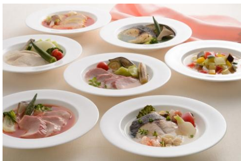
ヒルズ・エピキュール (盛り付け例)