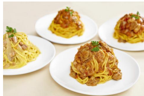
パスタ de スリム (盛り付け例)