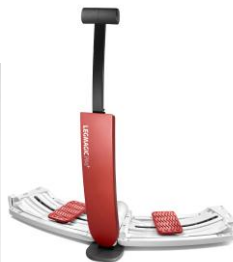
レッグマジック プラス