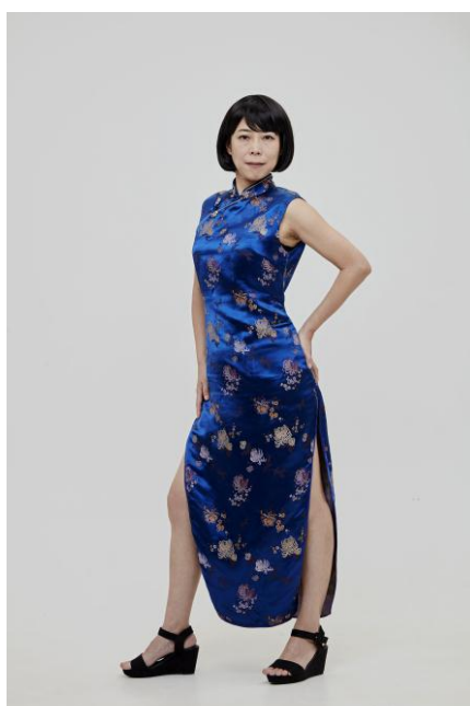
かつては妊婦と間違えられたネタ用の チャイナドレスをすっきり着こなしました