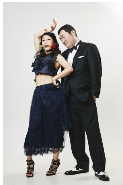
チャレンジアフター撮影での ご夫婦そろってのワンシーン