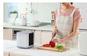
キッチンで料理中に