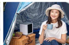
野外で活動するときに

約 1.5kg ※8 と軽量・コンパクトな卓上サイズで、取っ手が付いているため、持ち運びに便利です。利用シーンは様々。リビングでくつろぐときや、ご自宅でのテレワーク中はもちろん、脱衣所などのエアコンがない部屋や、調理の熱で暑いキッチンでも活躍します。コンセントはもちろん、モバイルバッテリーでも稼働 ※9 するため、コンセントのない場所やキャンプなどのアウトドアシーンでもお使いいただけます。