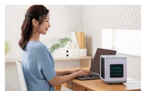
自宅でのテレワーク中に