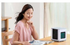
リビングでくつろぐときに