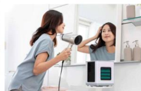
脱衣所でドライヤー中に