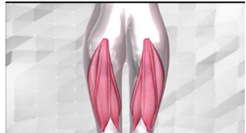
ハムストリングス