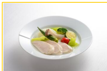
しっとり鶏むね肉と野菜のポトフ

「Hill's Epicure(ヒルズ・エピキュール)」商品盛り付け例（7味各1食）