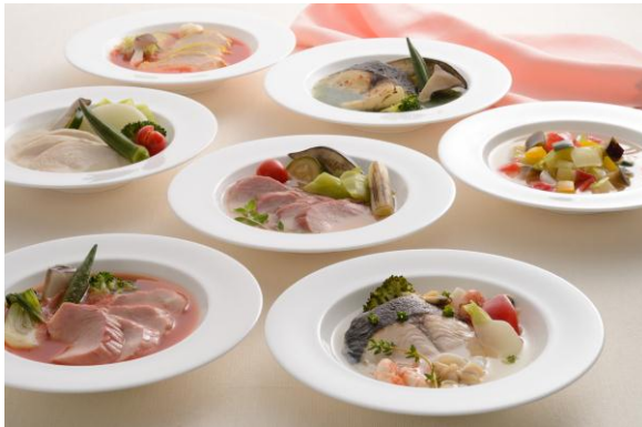
「Hill's Epicure(ヒルズ・エピキュール)」 盛り付けイメージ