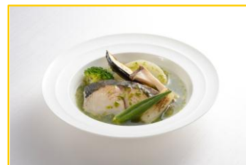
炙り鱈の青海苔ソース