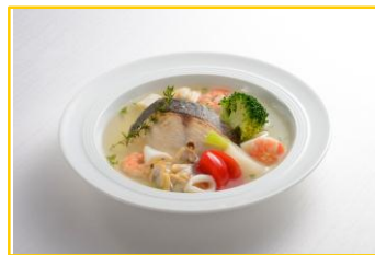
鱈と魚介のアクアパッツァ