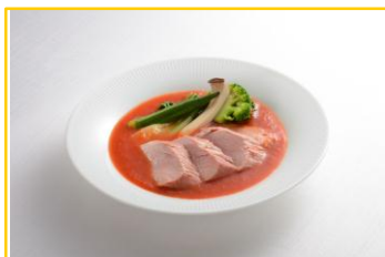
豚フィレ肉のアラビータソース