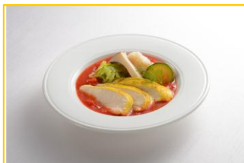
やわらか鶏むね肉のカレー風味香草ソース