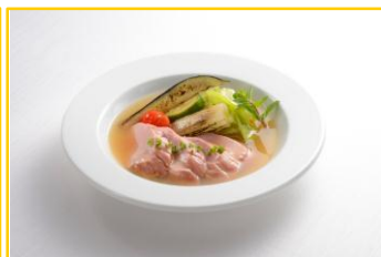
豚フィレ肉のジンジャーソース