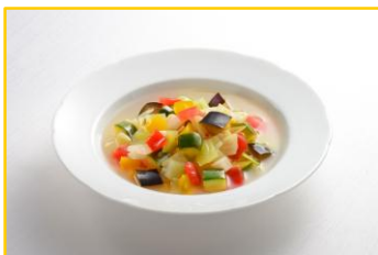
彩り野菜の食べるミネストローネ