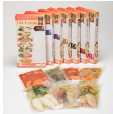
「Hill's Epicure(ヒルズ・エピキュール)」 パッケージ・パウチイメージ