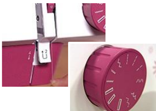
シンプル設計で操作が簡単