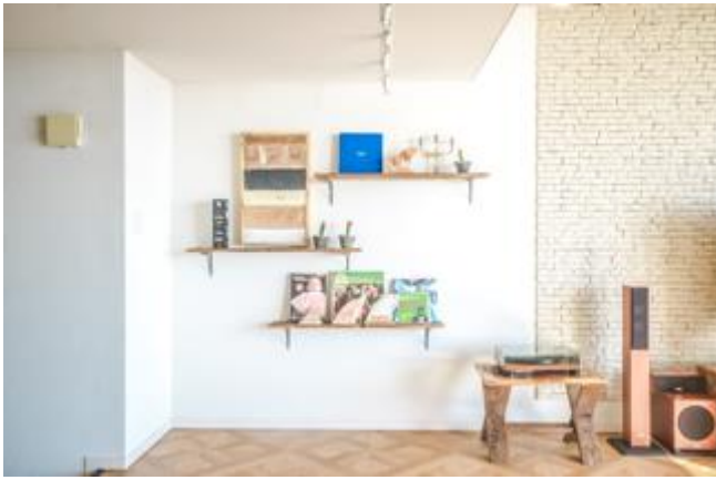
レコードプレーヤーや写真集