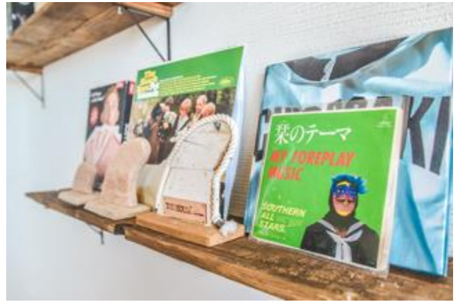
茅ヶ崎ならではの写真集やレコードも。