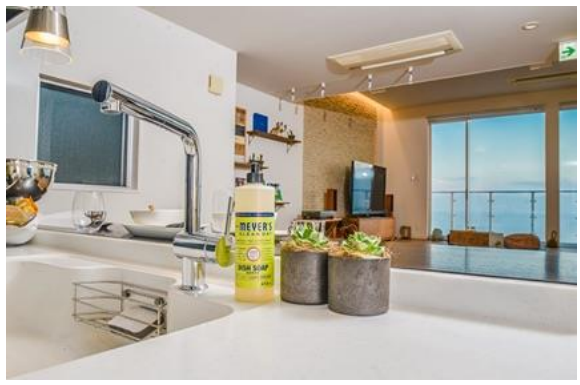
おしゃれなキッチングッズたちを揃えました。