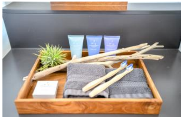
エシカルな竹の歯ブラシなどをご用意。