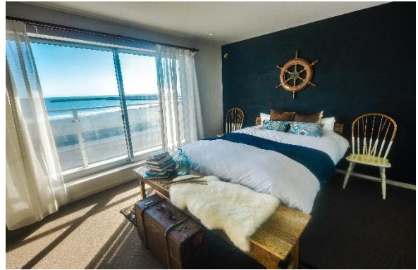
オーシャンビューのベッドルーム。