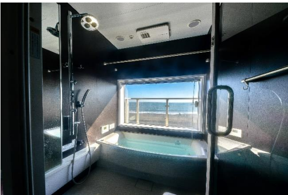
オーシャンビューのバスルーム。