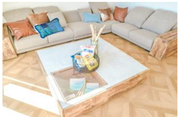
リメイクしたオリジナル家具