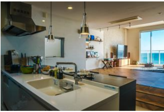
海とリビングを見渡すキッチン。